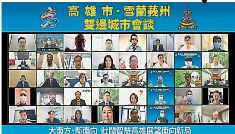
在线上合照。 「雪兰莪州与高雄市企业圆桌会谈」参与者

他表示，“亚洲新湾区5G AIoT创新园区”是结合高雄市政府、经济部、交通部、国发会等中央跨部会能量，投入园区开发、人才中心、新创基地、5G AIoT智慧设施，是台湾投资额最大、最完整的5G AIoT实证场域，预计5年总计将投入超过100亿