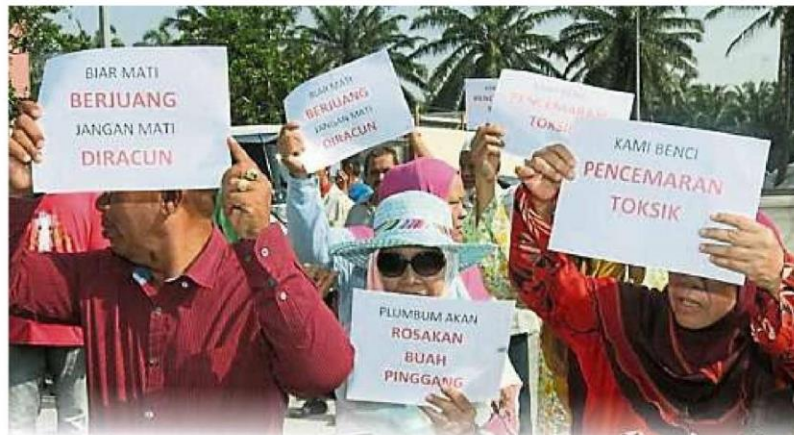
甘榜仁嘉隆居民和环保协会多次召集纠察行动，要求当局关闭或迁移电池厂。(档案照)

瓜冷市议会同意，在设于仁嘉隆中型工业区的电池厂，一旦能遵守由环境局和市议会规定的所有条件后，市议会可考虑发出全面营运执照；惟会先发出的只是为期两年、需每半年更新的临时执照，但现阶段也还没发出临时执照。