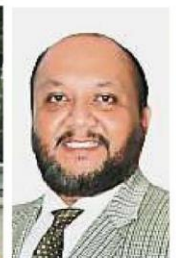
阿米鲁：电池厂需满足市议会规定的条件，才会先获得为期两年的临时营业执照。