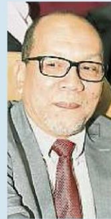
依茲漢：雪州政府不涉及稽查報告指未達标的冷岳2濾水站計劃，該計劃隸屬財政部子公司水務資產管理公司。

（沙亞南30日訊）對於《2019年第二系列總稽查司報告》指雪州冷岳2濾水站計劃（LRAL2）未达标一事，雪州政府撇清關係和該計劃無關，因有關計劃是由財政部子公司水務資產管理公司（PAAB）全權負責，並盛贊對該計劃的稽查恰逢其時。