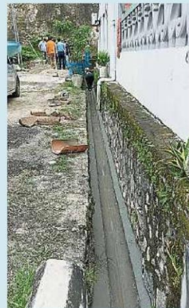
多年来未获处理的沟渠问题，除了沟渠瓦片全部更换，也会重新调整水平线。